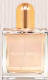
10 Rose Nude Nota olfativa floral apolvada Eau de Parfum