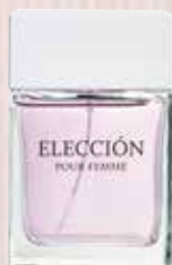
5 Elección Nota olfativa floral intensa Eau de Parfum