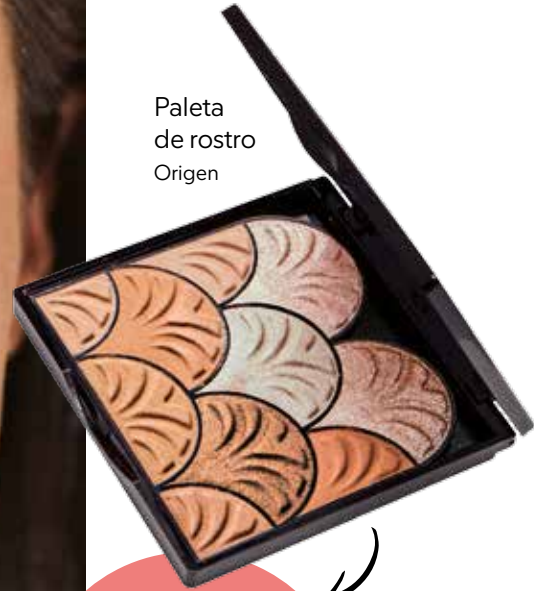
Paleta de rostro Origen

La mezcla de iluminadores es la clave para resplandecer por el día evitando excesivos brillos.