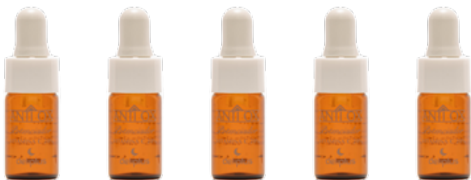
x5 BOOSTERS 20% VITAMINA C