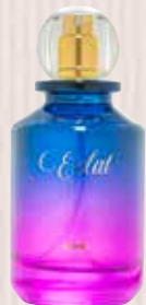
4 Éclat Shine Nota olfativa oriental, frambuesa, fruta roja Eau de Parfum