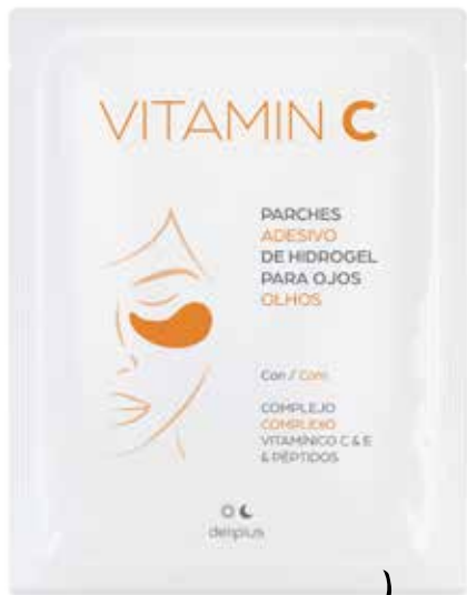
PARCHES HIDROGEL VITAMINA C PARA OJOS