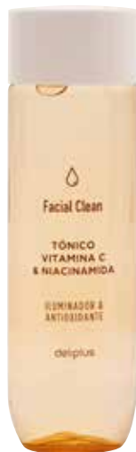
TÓNICO CON VITAMINA C Y NIACINAMIDA