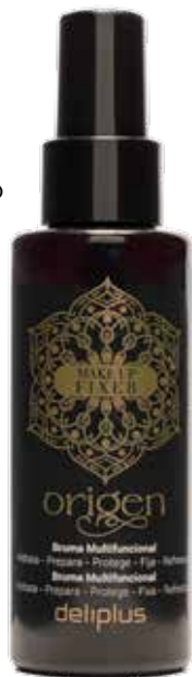
Bruma de rostro Origen

Aplica la bruma antes de tu rutina de skincare diaria para preparar la piel, o después del maquillaje para aumentar su duración.