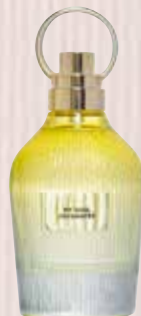
8 My Soul Enchanted Nota olfativa oriental Eau de Parfum