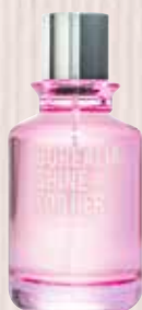
7 Borealia Shine For Her Nota olfativa frutal Eau de Parfum