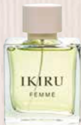
1 Ikiru Femme Nota olfativa cítrica Eau de Toilette