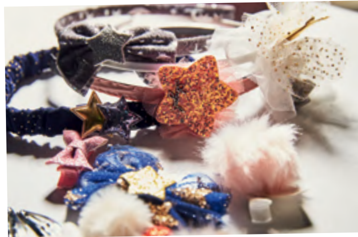
Accesorios infantiles para el cabello Pinzas, ranas, turbante y diademas.