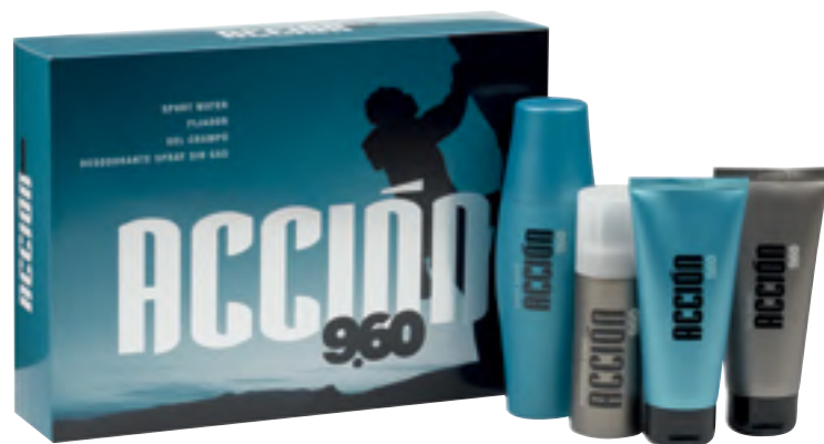
Acción 9.60. Sport water, fijador, gel-champú y desodorante en spray sin gas.