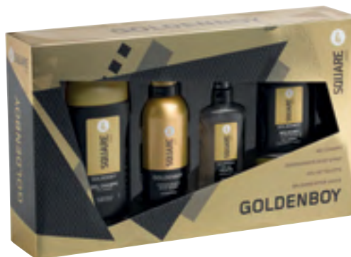
Goldenboy 4Square Gel-champú, desodorante body spray, eau de toilette y bálsamo after shave.