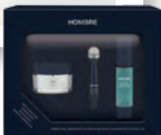
Vído Hombre. Crema facial hidratante 24h, sérum anti-edad y contorno de ojos roll-on.