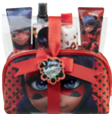
Prodigiosa Set de baño y perfume.