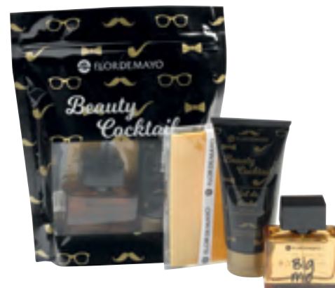
Beauty Cocktail Flor de Mayo. Gel de ducha, fragancia Big mio y complemento.