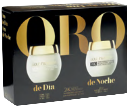
24K Gold Progress Crema oro de día 50 ml. y crema oro de noche, ahora también de 50 ml.

Neceseres, en diferentes modelos y tamaños para elegir.