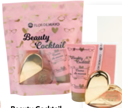
Beauty Cocktail Flor de Mayo Crema de manos, fragancia Big Gold Love y complemento.