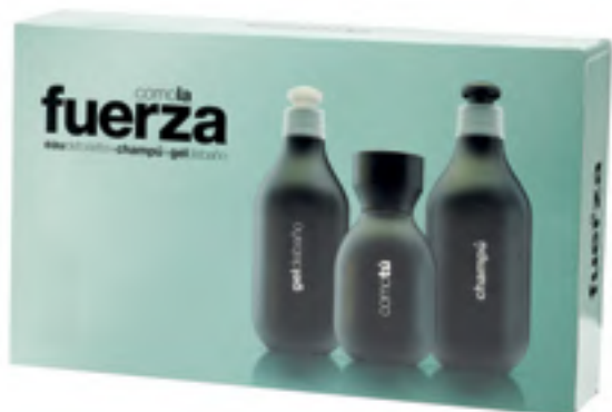
Comotú Fuerza Eau de toilette, gel de baño y champú.