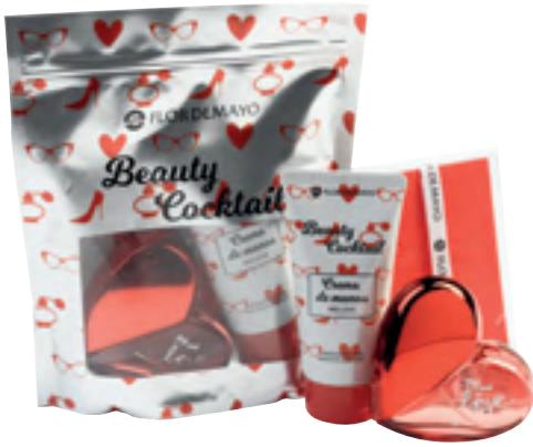
Beauty Cocktail Flor de Mayo Crema de manos, fragancia Big Red Love y complemento.