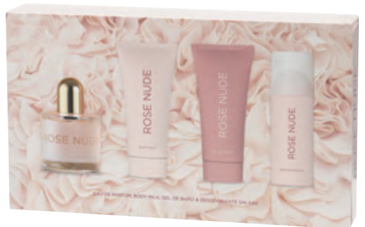
Rose Nude. Eau de parfum, body milk, gel de baño y desodorante en spray sin gas.