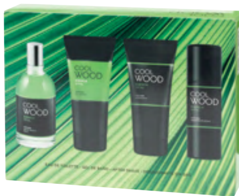
Cool Wood Esencia Vital Eau de toilette, gel de baño, after shave y desodorante en spray sin gas.