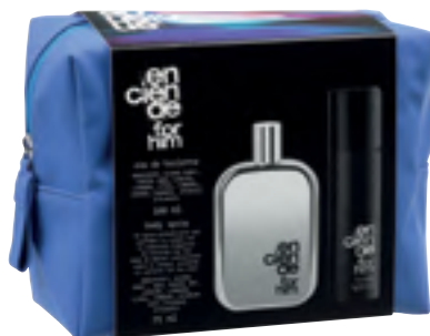
Enciende for him Eau de toilette, body spray y neceser.