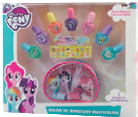
My Little Pony Set de manicura.