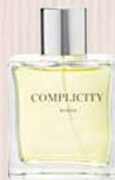
3 Complicity Nota olfactiva floral Eau de Toilette