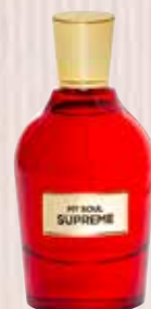
9 My Soul Supreme Nota olfactiva entitat floriental Eau de Parfum