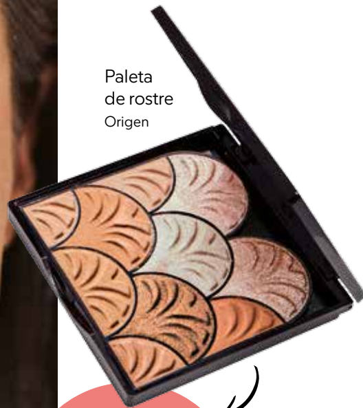
Paleta de rostre Origen

La mescla d'il·luminadors és la clau per resplendir durant el dia i evitar brillantor excessives.