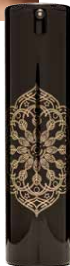
Il·luminador de rostre Origen

Aconsegueix un maquillatge per a cada ocasió amb la col·lecció de maquillatge Origen . Aplica l' il·luminador de rostre i esculpeix-lo amb l'ajuda de les pólvores de sol fosques. Ressalta la mirada amb la màscara de pestanyes i acoloreix els llavis amb el fluid que més t'agradi. La nostra recomanació és que empris el rosat núm. 03 durant el dia, per aportar vivacitat i calidesa als llavis, i el nude núm. 02 a la nit, ja que realça els llavis d'una manera natural. Per acabar, segella el maquillatge amb la broma . La pell et quedarà sucosa i amb un acabat molt rejuvenidor.