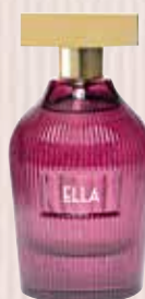
6 Ella Nota olfactiva entitat floriental Eau de Parfum