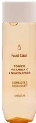
TÒNIC AMB VITAMINA C I NIACINAMIDA