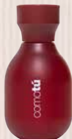
2 ComoTú Amor Nota olfactiva oriental Eau de Toilette