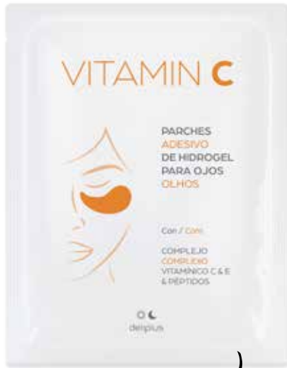
PEGATS HIDROGEL VITAMINA C PER ALS ULLS